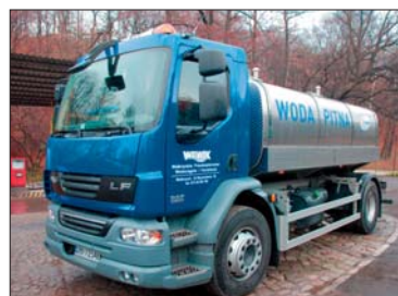
W trosce o jakość usług Spółka wymienia stare, wysłużone beczkowozny na nowe.

W trosce o klienta uruchomiło Centrum Obsługi Klienta, które wciąż jest doskonałe dzięki sugestiom i uwagom klientów. Wałbrzyskie Przedsiębiorstwo prowadzi własną stronę internetową, ocenianą jako jedną z najlepszych w branży. Na bieżąco współpracuje z lokalnymi mediami, przekazując za ich pośrednictwem ważne informacje. Wałbrzyskie Przedsiębiorstwo Wodociągów i Kanalizacji Sp. z o.o. jest silne tradycją i doświadczeniem. Wałbrzyskie Przedsiębiorstwo patrzy w wymagającą przyszłość ze spokojem dzięki Pracownikom - wysokiej klasy specjalistom, którym można ufać. ■