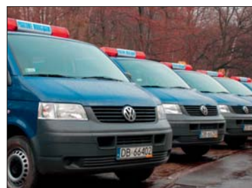
Nowoczesny tabor pogotowia wodociągowo-kanalizacyjnego.