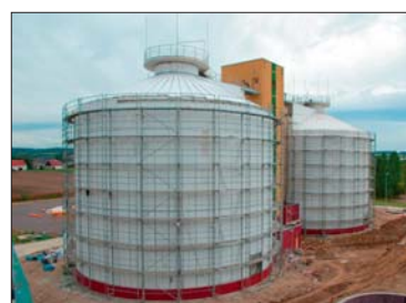
Wałbrzyskie wodociągi obsługują nowoczesne oczyszczalnie ścieków.