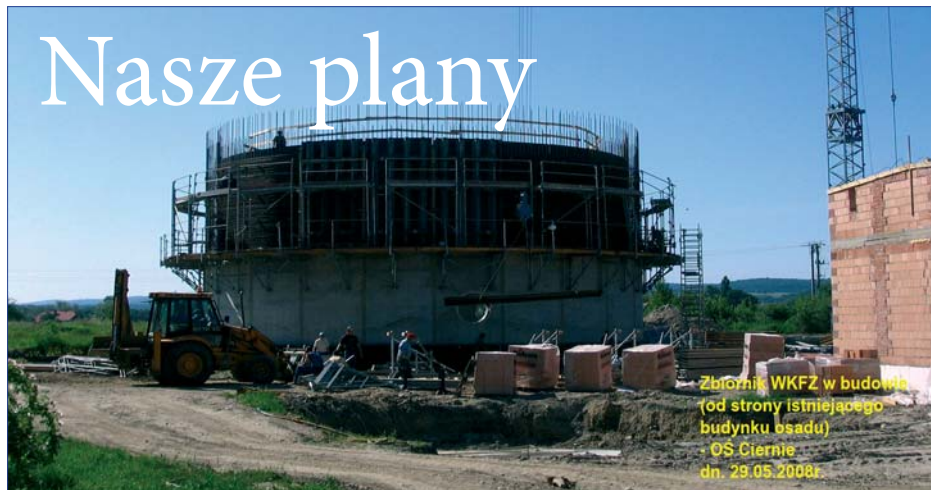
Zbiornik WKFZ w budowie (od strony istniejącego budynku osadu) OS Ciermie dn. 29.05.2008r.